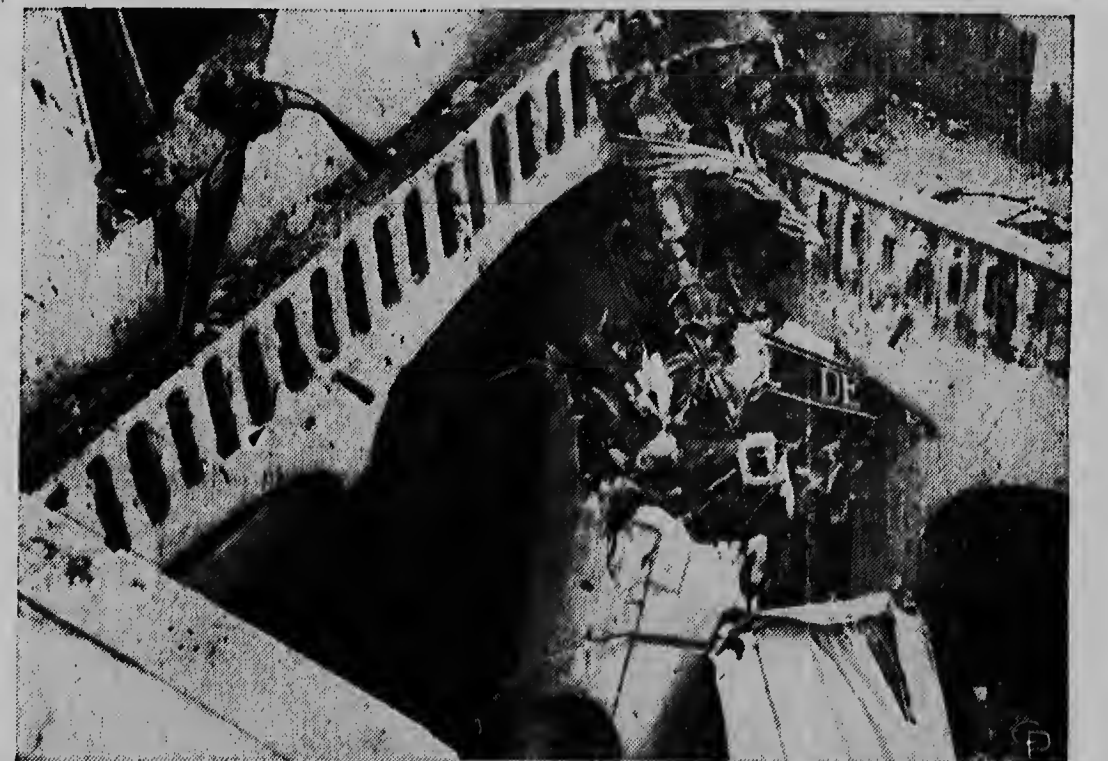
E portret aqui ta muntra un parti dje romp i motor dje C-47 di dos motor. E avion aqui a dal na Puebla (Mexico) contra un edificio cu tabata consisti di diferente flat. E aparato tabata riba camina di Mexico pa Merca. Siete die 8 persona di tripulacion die avion a muri.

Trata na aumenta e entrananan foy trahao y profesion y haci algo pa bo relacionnan social.